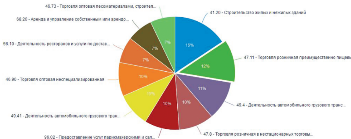
Рис. 2. Состав малого и среднего бизнеса по видам экономической деятельности в 2018 году, %

Из данных Аналитического доклада Всемирного Банка (World Bank) «Ведение бизнеса 2018. Реформирование для создания рабочих мест» видно, что позитивные изменения в российской экономике и политике, безусловно, происходят, однако общий рейтинг не достаточно высок. Также можно выделить отдельные составляющие рейтинга, которые имеют весьма низкие значения (таблица) [5]. Все это говорит о том, что необходимо продолжать работу по улучшению предпринимательского климата, целесообразно частично пересмотреть меры поддержки, предоставляемые предпринимателям.