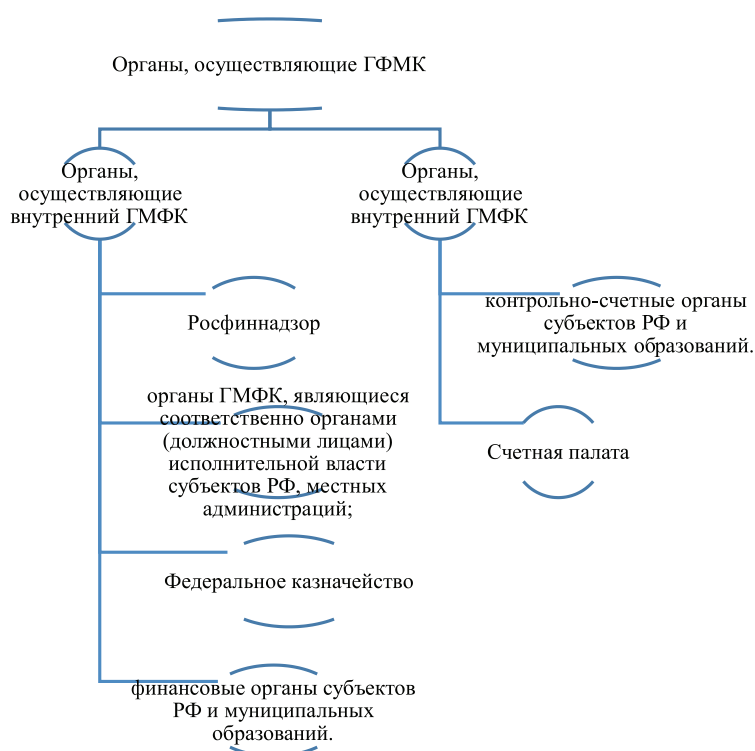
Рис. 2. Органы, осуществляющие ГФМК

Существуют органы, которые осуществляют ГФМК (рис. 2). Условно, их можно разделить на органы, которые осуществляют внутренний/внешний контроль. Согласно Приказу Федерального Казначейства от 29 декабря 2017 г.