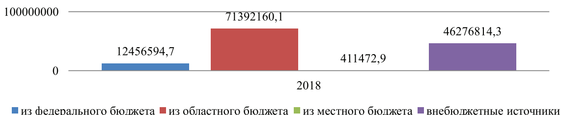
Рис. 1. Финансирование государственных программ по источникам поступления средств Волгоградской области за 2018 год, тыс. рублей. Источник: http://docs.cntd.ru/document/441767922

Помимо этого установлено, что по ряду показателей плановые значения 2018 года ниже фактически сложившихся за 2017 год, что свидетельствует о необоснованном занижении плановых показателей с целью достижения более высокого результата их исполнения. Примеры таких случаев приведены в таблице.