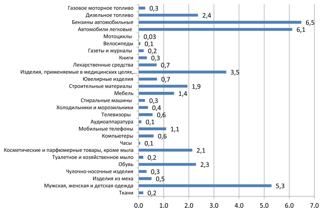
Рис. 3. Доля товарных групп непродовольственного сегмента Российской Федерации (укрупненная группировка по методике Росстата, формулировка названия сохранена) в 2018 г., %

Продажи автомобильного бензина составляют наибольшую долю (6,5%) в структуре непродовольственной части оборота ритейла страны. Немного менее, а именно 6,1%, занимают «автомобили легковые». По удельному весу третье место рассматриваемого сегмента принадлежит группе мужской, женской и детской одежды (5,3%). Медицинские изделия (в том числе ортопедические) продаются населению в объеме 3,5% от всего объема продаж. Более 2% занимают косметические и парфюмерные товары. С оборотом туалетного мыла эта группа формирует 2,3% оборота. Это сопоставимо с продажами обуви (также 2,3%). Мобильные телефоны продаются на 1,1%, компьютеры на 0,6%.