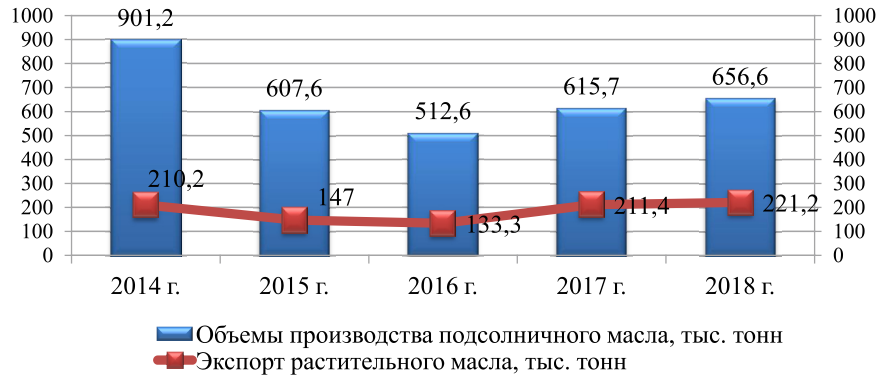
Рис. 1. Объемы производства и экспорта подсолнечного масла в Краснодарском крае 2014-2018 гг.