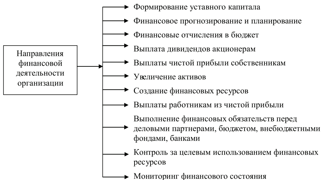
Рис. 1. Направления финансовой деятельности организации. Составлен автором с использованием источника [5]

– неудовлетворительное финансовое состояние предприятий, балансы которых отягощены просроченной дебиторской задолженностью, долговой нагрузкой или задолженностью по налогам;