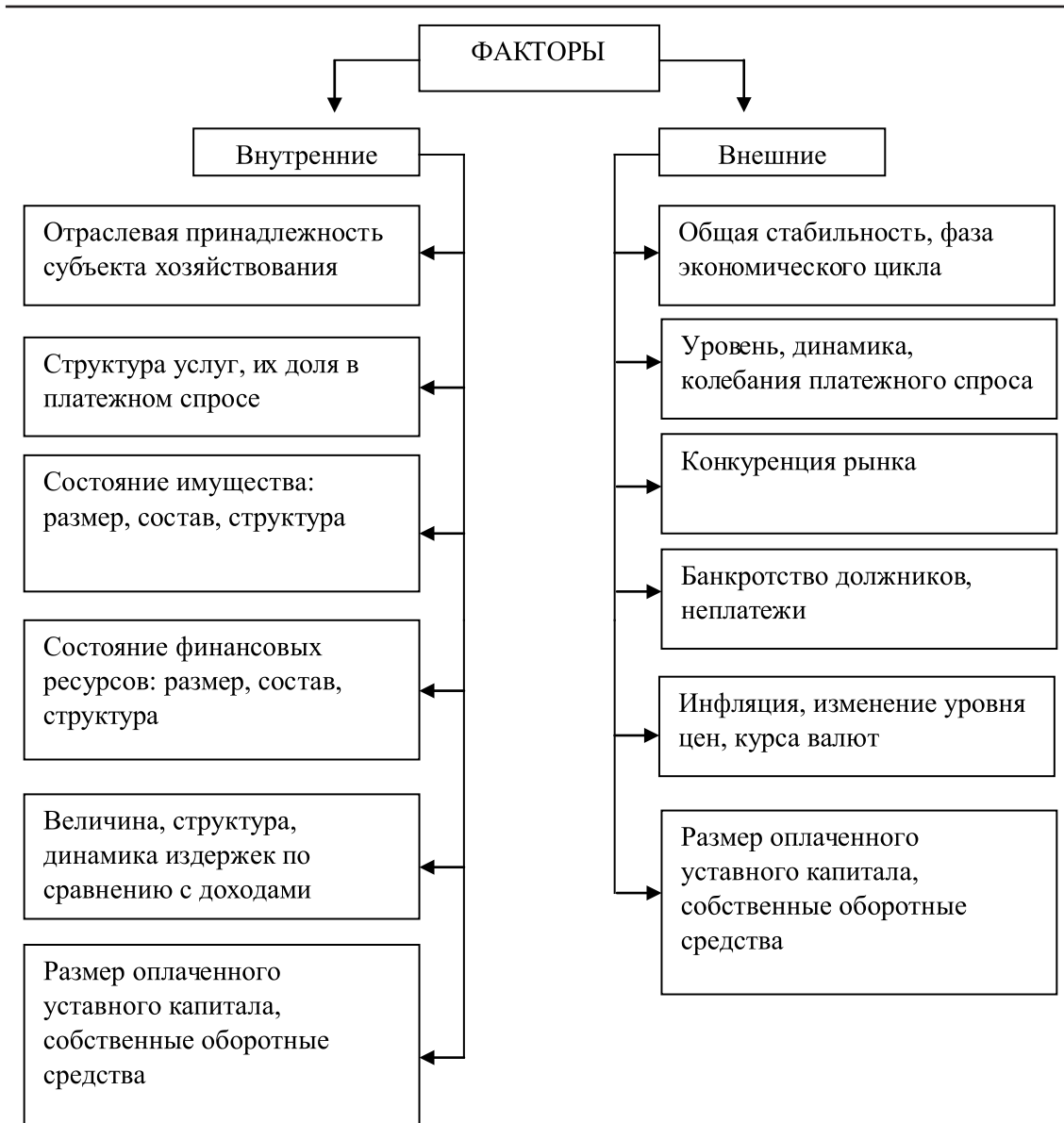
Рис. 1. Факторы, влияющие на финансовую устойчивость

Чаще всего при определении финансовой устойчивости используют анализ финансовых коэффициентов.