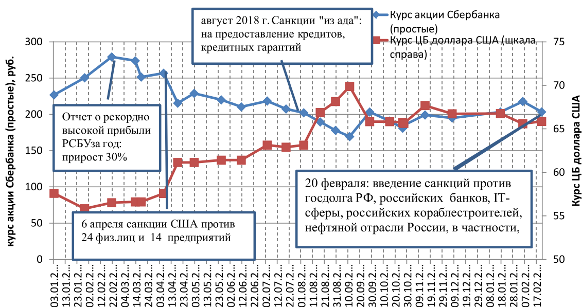
Рис. 1. Динамика курса простых акций ПАО Сбербанк на ММВБ и официальный курс доллара США[9]