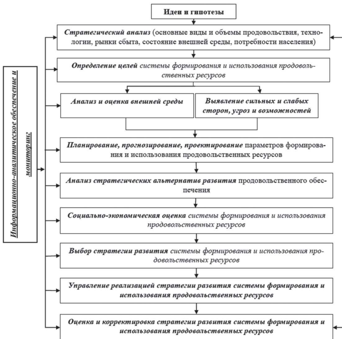
Рис. 1. Этапы стратегического управления формированием и использованием продовольственных ресурсов

Стратегическое управление продовольственными ресурсами представляется как специфичный тип управления, который базируется на применении экономических, организационных, правовых и мотивационных инструментов реализации долгосрочной стратегии социально-ориентированного формирования и использования продовольственных ресурсов с учетом территориальной и отраслевой специфики регионов [1].