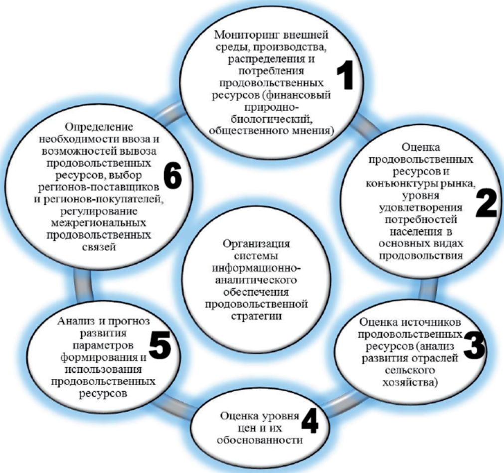
Рис. 4. Элементы системы информационно-аналитического обеспечения продовольственной стратегии

научно-технических, организационных, информационных мер по формированию продовольственных ресурсов, расширение емкости продовольственного рынка, обеспечение достаточности и экономи-