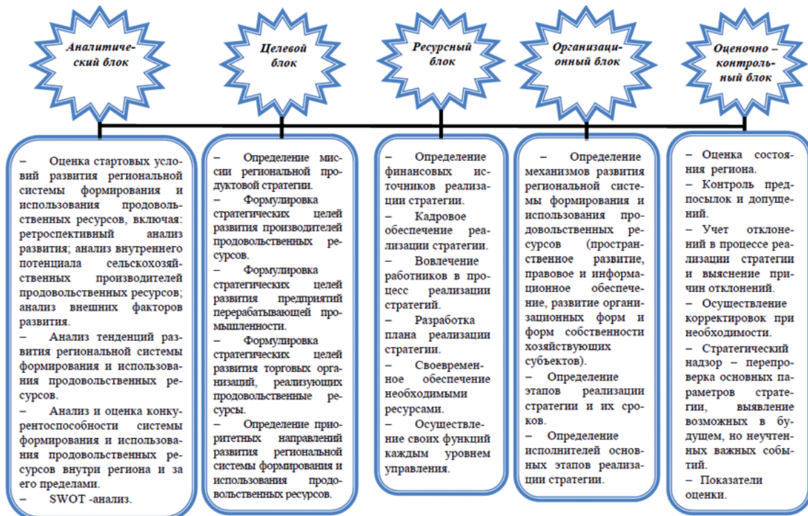
Рис. 3. Структура стратегии развития региональной системы формирования и использования продовольственных ресурсов

среднедушевой калорийности питания); это позволяет выявлять альтернативные стратегические варианты прироста производства продовольственных ресурсов, возможности обеспечения внутреннего спроса на продовольствие, развития межрегиональных и экспортных продовольственных связей, степень социально-экономической достаточности региона.