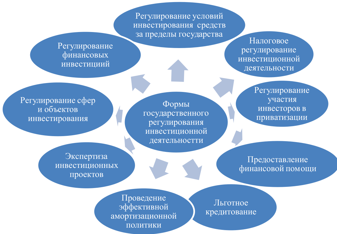
Рис. 1. Основные формы государственного регулирования инвестиционной деятельности