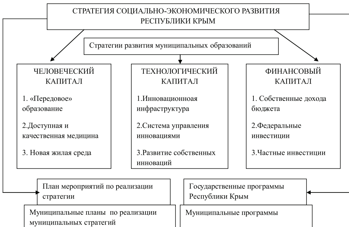
Рис. 1. Стратегия социально-экономического развития Республики Крым или Стратегия «Трёх побед». Составлено автором [1]