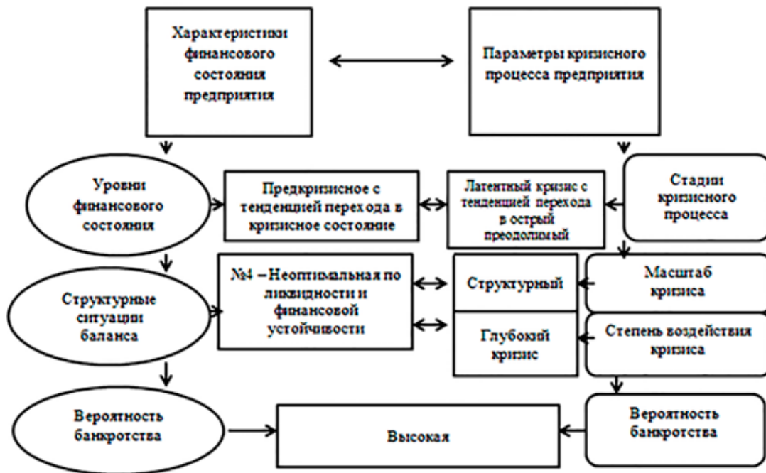
Рис. 3. Результат определения параметров кризисного процесса анализируемого предприятия по характеристикам финансового состояния

Таким образом, в рассматриваемый период времени, ООО «Южная Корона» Брюховецкий комбикормовый завод находился в предкризисном состоянии (с возможностью перехода в стадию острого преодолимого кризиса), вызванном неоптимальной структурой баланса (по ликвидности и финансовой устойчивости), с высокой вероятностью банкротства. И, несмотря на то, что ему удается наращивать объемы выручки и прибыль, предприятие не обладает достаточностью собственных финансовых ресурсов, основным источником финансирования являются заемные средства. Поэтому ключевые мероприятия по его финансовому оздоровлению должны быть направлены на оптимизацию структуры активов (имущества) предприятия и его источников (капитала) предприятия и содержать: - увеличение собственного капитала, путем дополнительного прироста прибыли предприятия; - повышение эффективности использования заемного капитала; - оптимизацию оборотного капитала и его составляющих; - реализацию излишних, устаревших, неиспользуемых и полностью изношенных объектов основных средств.