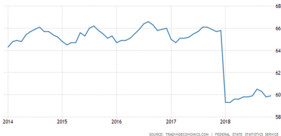
Рис. 1. Уровень занятости населения (в %), в РФ в 2014-2019 гг. Источник: [Портал Федеральной статистики Tradingeconomics.com]