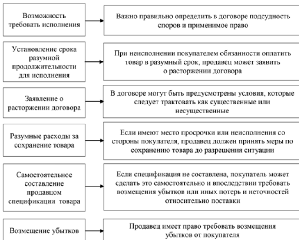
Рис. 2. Средства правовой защиты продавца

Таможенная декларация выполняет не просто функцию описи. Она подтверждает наличие специального разрешения на перевозку груза через границу. Таможенный орган ставит свои отметки, разрешительные визы о том, что данное перемещение не противозаконно.