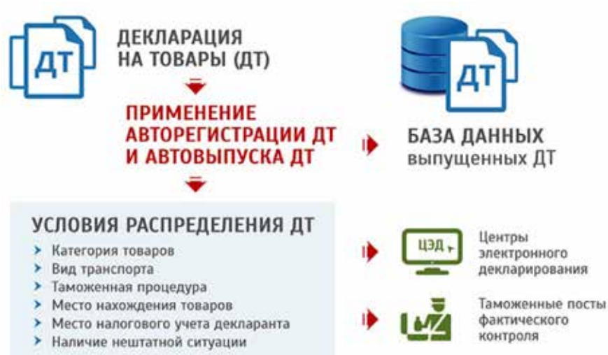
Рис. 4. Схема электронной регистрации таможенной декларации и ее распределение по центрам электронного декларирования в РФ

Таможенная декларация является обязательным атрибутом внешнеторговой сделки при торговле Российской Федерацией и 98 государствами. При этом обязательным является выполнение следующих условий: