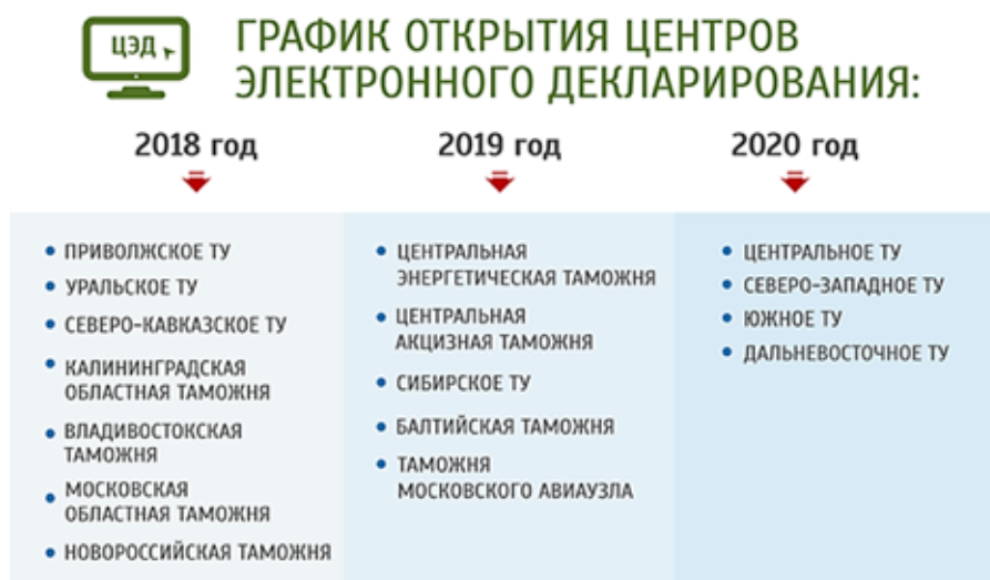
Рис. 3. График открытия электронных таможен в России в 2018-2020 гг.