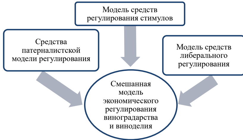
Рис. 2. Формирование смешанной модели экономического регулирования виноградарства и виноделия

Смешанная модель позволяет адаптировать механизмы экономического регулирования виноградарства и виноделия к конкретным условиям в разные периоды и лучше направлять их на цели развития отрасли.