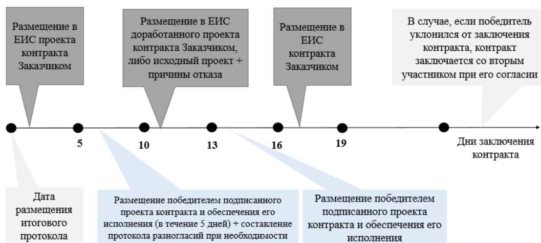
Рис. 2. Этапы подписания контракта в ЕИС после размещения итогового протокола [3]

Весь процесс заключения контракта осуществляется при участии оператора электронной торговой площадки. Если участник, который размещал заказ, уклоняется от подписания государственного контракта, оператором электронной торговой площадки вносится информация в реестр недобросовестных поставщиков об участнике сроком на 2 года. В современных условиях многие подрядчики пребывают в неустойчивом финансовом состоянии и постоянной ценовой борьбе, поэтому очень часто наступает ситуация, когда полный объем обеспечения исполнения контракта и заключение самого контракта не представляется возможным. Именно по этой причине исполнители и подрядчики, которые не предоставили нужные документы или не осуществили другие действия должным образом, заносятся в реестр недобросовестных поставщиков.