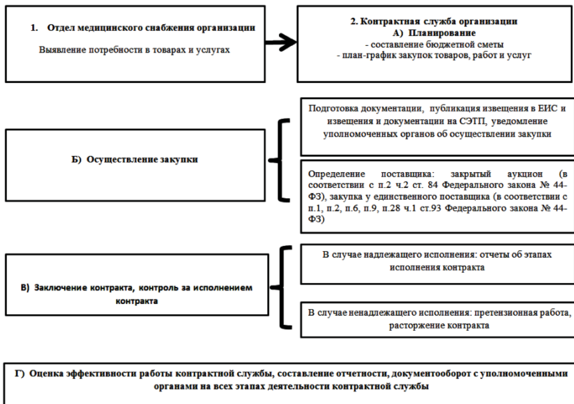
Рис. 1. Организация закупочной деятельности в лечебном учреждении МО РФ