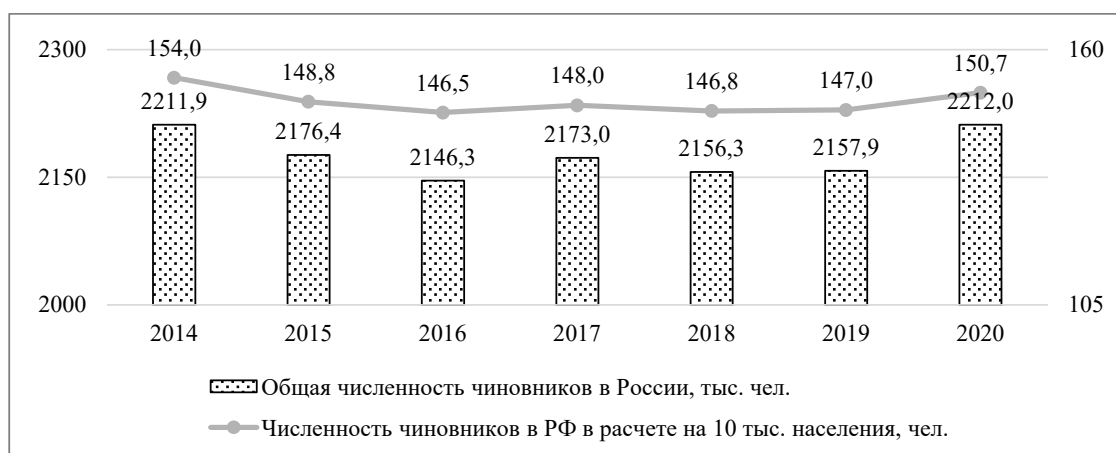
Рис. 1. Динамика численности государственных служащих в России всего и в расчете на 10 тыс. населения в 2014-2020 гг.

Численность чиновников регионального уровня в России в период 2014-2019 гг. имела тенденцию к снижению с 2162 тыс. чел. до 2107 тыс. чел., т.е. на 2,5%, при этом наибольшее снижение произошло в период 2014-2017 гг. В последние 2 года наметилась тенденция к росту численности региональных чиновников до 2163,1 тыс. чел., что на 2,7% выше уровня предыдущего года. Оценка данных в разрезе федеральных округов страны показала, что в период 2014-2017 гг. для большинства округов общей тенденцией было сокращение численности чиновников, причем в наибольшей степени в ЦФО – на 5,8%. При этом исключением является ЮФО, где произошел прирост на уровне 13,2%, в результате чего в 2017 году общая численность чиновников в данном округе составила 223,5 тыс. чел. В период 2017-2019 гг. в большинстве федеральных округов страны не произошло существенных изменений, за исключением ДФО, где прирост составил 26,6%, и СФО, где произошло снижение на уровне 14% (таблица 1).