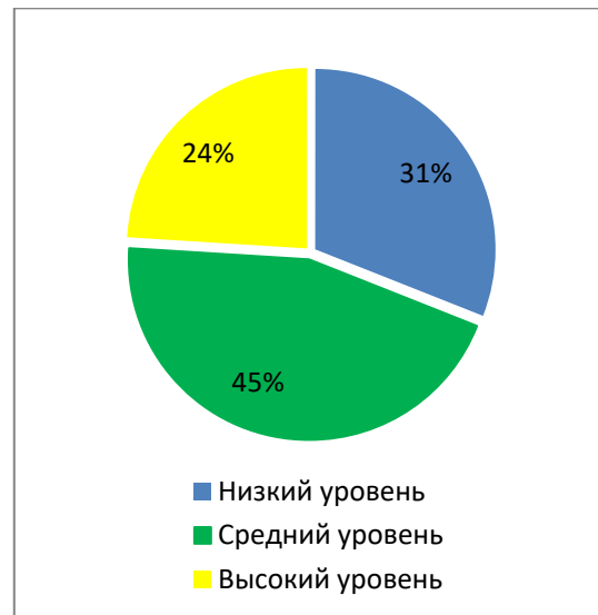
Рис. 1. Уровни финансовой грамотности представителей микро- и малого бизнеса Российской Федерации, %

Исследование показало, что у каждого третьего респондента отмечается низкий уровень финансовой грамотности (31%). 45% собственников бизнеса имеют средний уровень финансовой грамотности. 24% предпринимателей Российской Федерации обладают высоким уровнем финансовой грамотности (рисунок 1) [1].