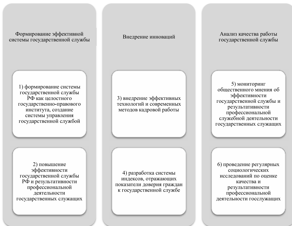
Рис. 1. Основные направления внедрения технологий кадрового обеспечения

Традиционные технологии кадрового обеспечения, предусматривающие конкурсный отбор, аттестацию государственных служащих, формирование кадрового резерва, четкое определение квалификационных требований к государственным служащим и многое другое, пока не обеспечили должную эффективность кадрового обеспечения государственной службы. «Слабыми звеньями» в этой системе явились такие, как: неразвитый механизм стимулирования труда, относительная закрытость государственной гражданской службы, ограниченность показателей, позволяющих оценить качество и результативность профессиональной деятельности государственных служащих. Работа в данных направлениях позволит не только оптимизировать технологии кадрового обеспечения, но и сделать более совершенным правовой механизм регулирования государственных служб и поднять на более современный уровень всю систему кадровой политики государственных структур [4].