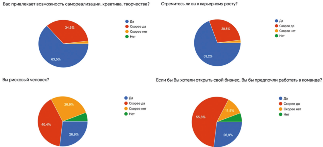
Рис. 1. Оценка личностных качеств респондентов.

Результат в вопросе по определению предпочтений в командной работе показал, что 62 человека (55,8%) скорее хотели бы работать в команде и 30 человек (26,9%) дали четкий ответ «Да», а 13 человек (11,5%) скорее предпочли бы работать собственными силами, 5 человек (5,8) дали однозначный отрицательный ответ.