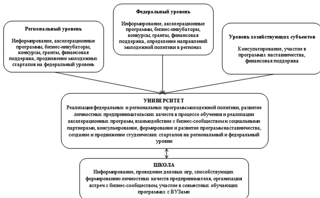
Рис. 4. Механизм мотивационного взаимодействия поддержки развития молодежного предпринимательства.

В современных условиях развитие малого бизнеса – одно из ведущих направлений реализуемых национальных проектов в России. Молодежь, как наиболее активная часть общества, обладает высоким предпринимательским потенциалом, требующим поддержки со стороны государства [6]. Исходя из этого, для развития молодежного предпринимательства в Смоленской области авторами предложен механизм мотивационного взаимодействия (рис. 4).