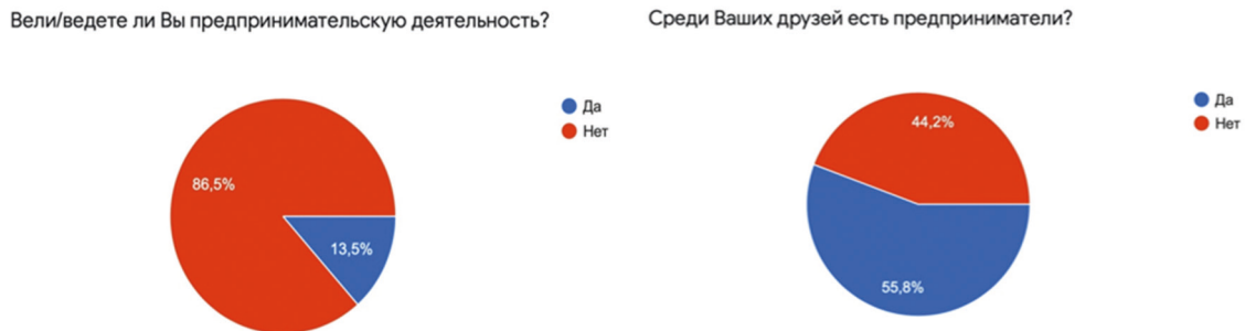
Рис. 2. Наличие опыта ведения предпринимательской деятельности и действующих предпринимателей в кругу общения у респондентов.

Для повышения заинтересованности в развитии предпринимательства, необходимо рассмотреть уровень осведомленности молодежи о мерах поддержки государством малого и среднего бизнеса (рис. 3).