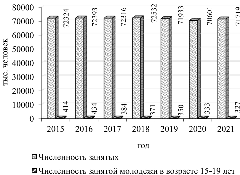
Рис. 2. Численность занятых в Российской Федерации, тыс. чел.