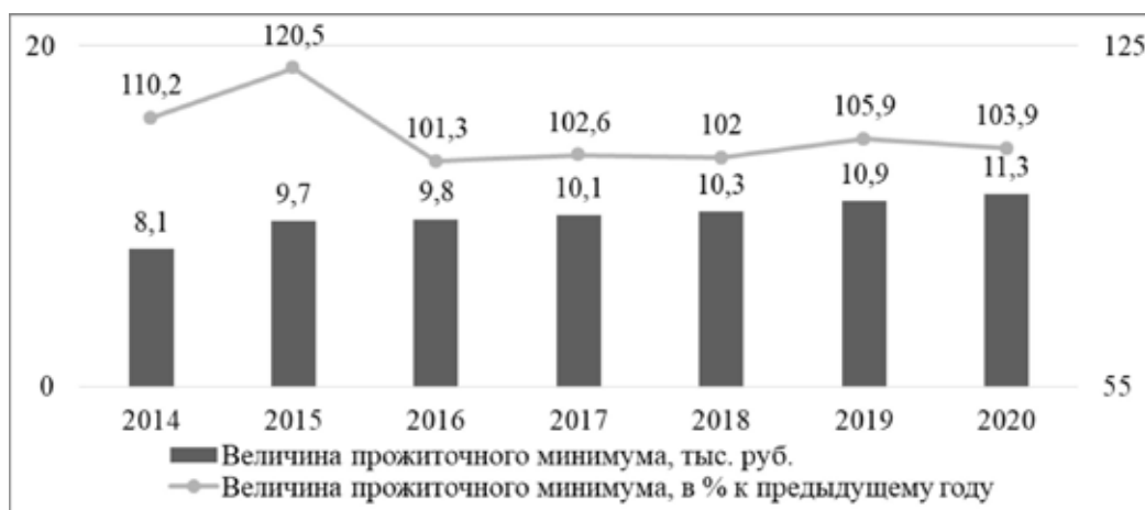
Рис. 3. Динамика величины прожиточного минимума в среднем на душу населения России в 2014-2020 гг.

Оценка изменения структуры населения России по величине среднедушевых доходов показала общую тенденцию к росту удельного веса групп в более высокими средними доходами при одновременном снижении удельного веса групп с самыми низкими доходами.