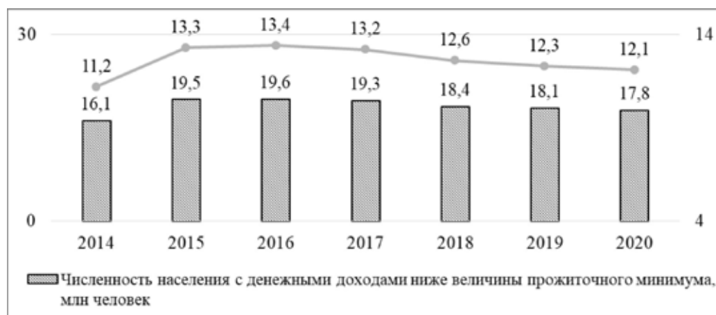
Рис. 4. Динамика численности и доли бедного населения в России в 2014-2020 гг.