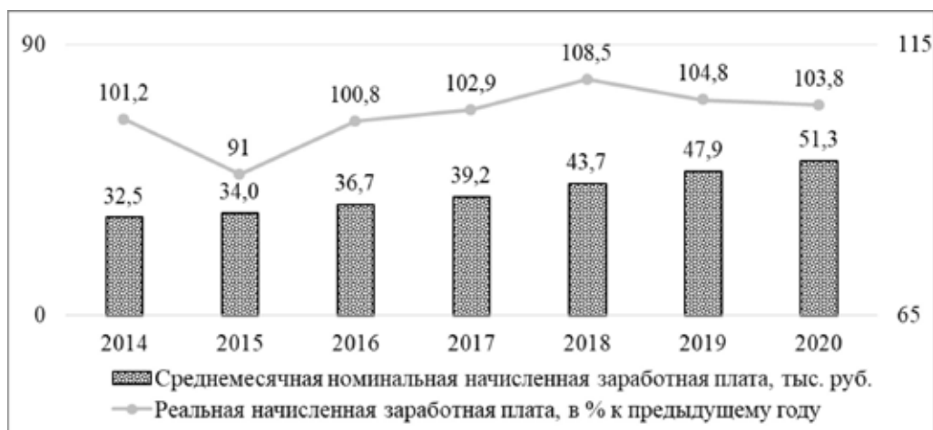
Рис. 1. Динамика среднемесячной номинальной и реальной начисленной заработной платы в России в 2014-2020 гг.