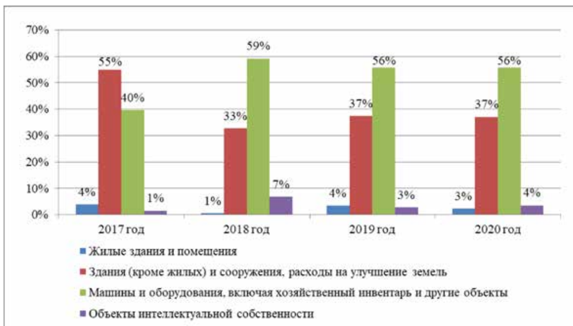
Рис. 5. Видовая структура инвестиций в основные фонды

По наглядному графику делаем вывод, что эпоха пандемии не оказала существенного влияния на видовую структуру инвестиций.