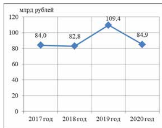
Рис. 1. Динамика объема инвестиций в основные фонды в г.о. Самара

Развитие деловой среды зависит от инвестиционных вложений в основные фонды, поскольку инвестирование позволяет повышать качество и увеличивать мощности производства [3]. Представим на рисунке 1 динамику объема инвестиций в основные фонды в г.о. Самара в период с 2017 по 2020 годы.