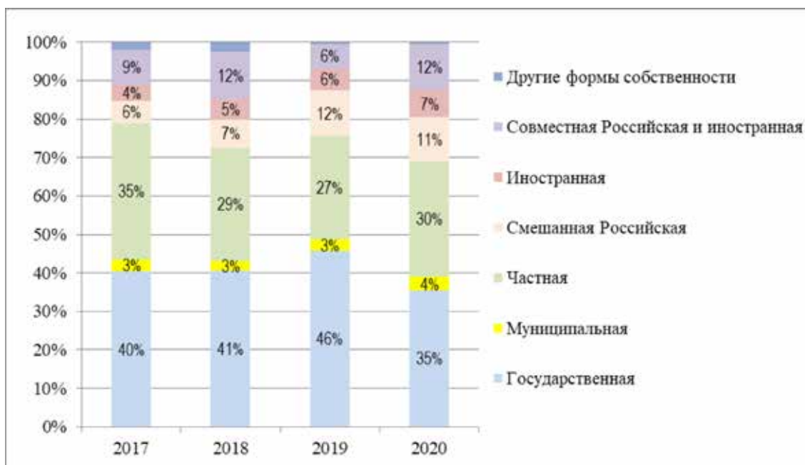
Рис. 3. Структура инвестиций в основные фонды по формам собственности