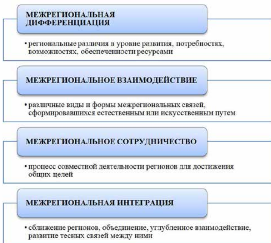
Рис. 1. Содержание этапов развития межрегиональных отношений [6]