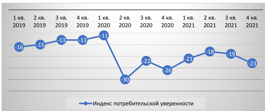
Рис. 6. Динамика индекса, отражающего потребительскую уверенность населения

Данные, представленные на рисунке 4 показывают, что во 2 квартале 2020 года, по мнению респондентов, значительно ухудшились условия для совершения крупных покупок. Значение индекса в абсолютном выражении снизилось на 20 пунктов и достигло минимального значения за анализируемый период. Аналогичные изменения выявили эксперты компании Deloitte: треть опрошенных отметили, что стали тратить меньше на покупку мебели, электроники, бытовой техники, строительных материалов, а 45% респондентов оказались вынуждены отложить дорогостоящие покупки [6].