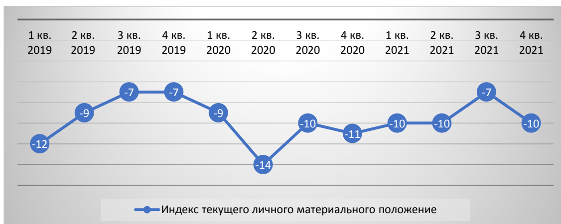
Рис. 1. Динамика индекса текущего личного материального положения населения РФ

В марте-апреле 2020 года инфляционные ожидания населения значительно выросли, 75% опрошенных респондентов отметили, что темп роста цен на товары и услуги увеличился относительно января-февраля 2020 года [4, с.2-3].