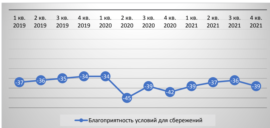
Рис. 5. Динамика индекса, отражающего благоприятность условий для сбережений