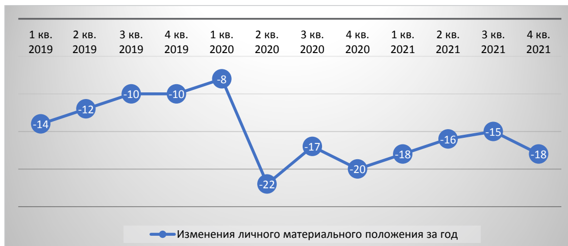
Рис. 2. Динамика изменения личного материального положения населения РФ за год