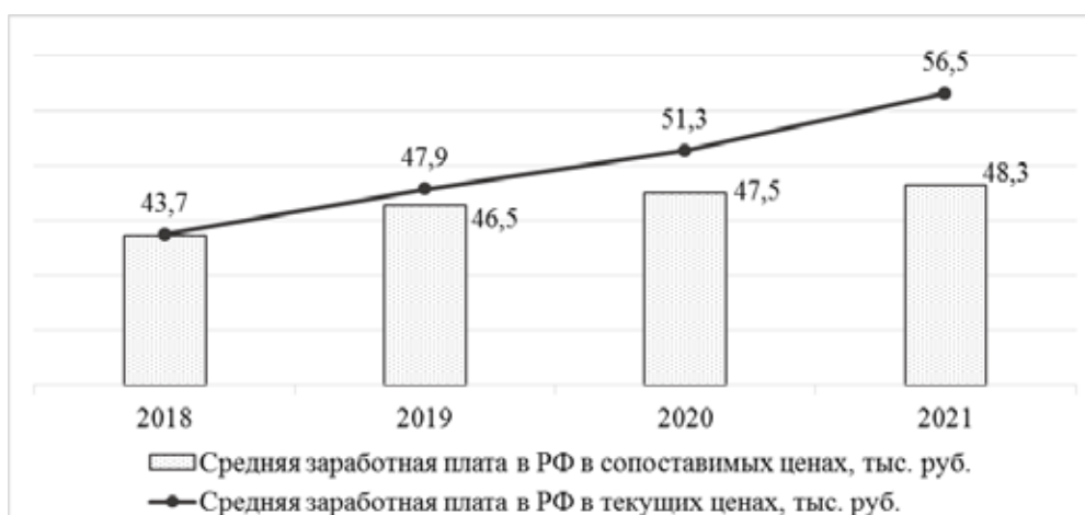
Рис. 1. Динамика средней заработной платы в России в текущих и сопоставимых ценах (уровня 2018-го года) в 2018-2021 гг.

При этом оценка данных в сопоставимых ценах показала, что фактический рост средней заработной платы является менее существенным, а наиболее высокий прирост был отмечен в 2018-2019 гг., когда реальная средняя заработная плата выросла практически на 3 тыс. рублей с 43,7 до 46,5 тыс. руб., а последние 2 года произошло снижение темпов роста реальной средней заработной платы, в результате чего в 2020 году прирост составил всего 1 тыс. руб., а в 2021 году еще меньше – 800 руб. Следовательно, можно говорить о том, что с течением времени происходит сокращение темпов роста реальной средней заработной платы в стране, что подтверждает ухудшение экономической ситуации.