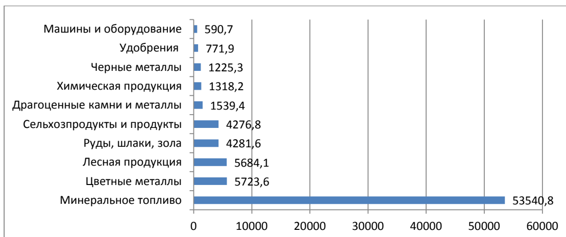
Рис. 2. Экспорт России в Китай в стоимостном выражении, 2021 г., млрд.долл.