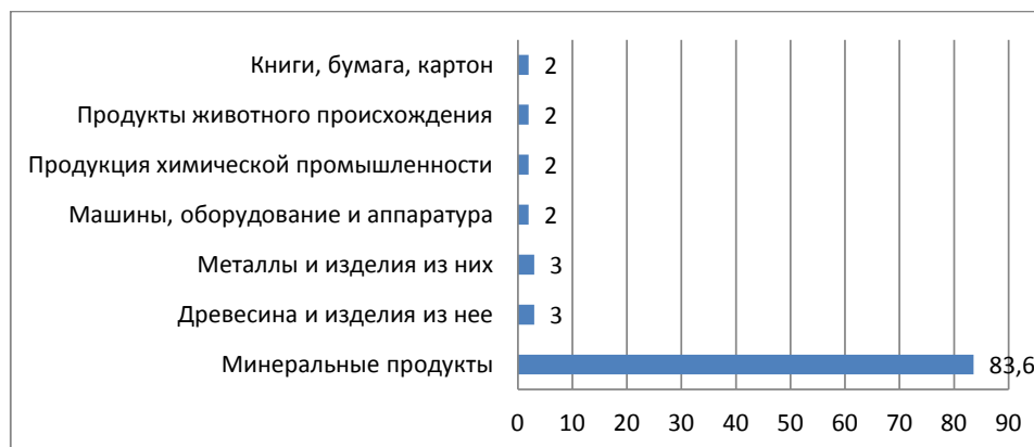
Рис. 1. Основные экспортируемые товары, январь 2022 г., %

Рисунок 2 показывает, что внутри группы «минеральное топливо, нефть, нефтепродукты» наблюдается рост по всем товарным позициям. Существеннее всего в стоимостном выражении увеличились российские поставки угля – на 184,9% более чем 7 млрд. долларов. Таможенная стоимость сырой нефти и нефтепродуктов выросла на 45,5% до 40,3 млрд. долларов, газа – на 81,2% до 4,3 млрд. долларов.