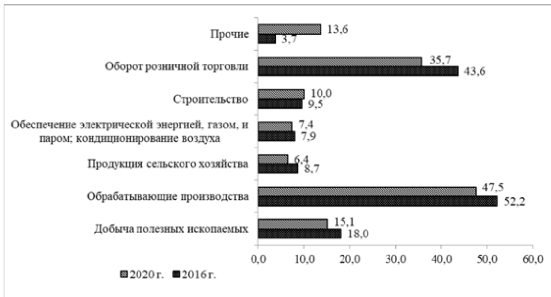
Рис. 5. Доля отгруженных товаров собственного производства, выполненных работ и услуг собственными силами в ВВП страны, %

Доля отгруженных товаров собственного производства, выполненных работ и услуг собственными силами в ВВП страны даже по наиболее перспективным и объемным направлениям инвестирования в российскую экономику в динамике снизилась, что не позволяет судить о прямой взаимосвязи между объемом вложенных в ключевые отрасли объемом инвестиционных ресурсов и влиянием этого процесса на изменение доли отдельных отраслей в ВВП страны.