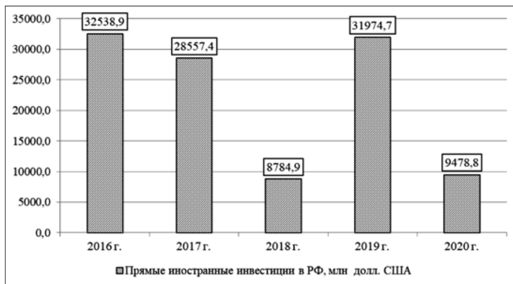
Рис. 3. Динамика прямых иностранных инвестиций в основной капитал Российской Федерации в разрезе ключевых отраслей экономики, млн. долл. США