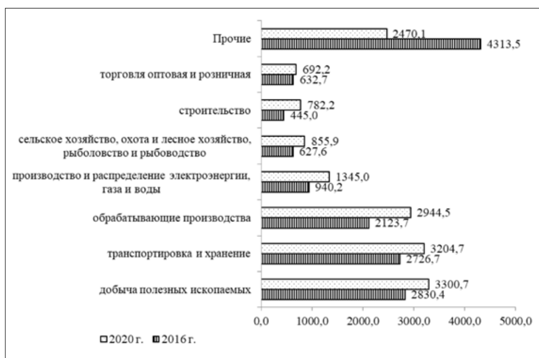
Рис. 2. Динамика инвестиций в основной капитал Российской Федерации в разрезе ключевых отраслей экономики, млрд руб.

В 2020 г. отмечается рост объемов инвестиций в основной капитал по всем ключевым отраслям национальной экономики, снижение объемов инвестиций по категории «Прочие» может быть связано с формированием адресного характера перераспределения инвестиционных потоков. Наиболее привлекательными для инвестирования являются «Добыча полезных ископаемых», «Транспортировка и хранение» и «Обрабатывающие производства». При этом наибольший прирост инвестирования отмеча-