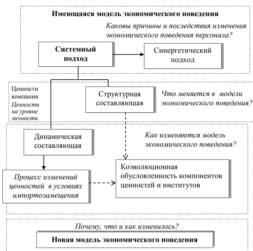
Рис. 2. Логика и компоненты комплексной методологии исследования влияния политики импортозамещения на экономическое поведение

Выбор комплексной методологии обусловлен, тем что, во-первых, авторы рассматривают экономическое поведение как образ, способ, характер экономических действий персонала, коллективов в тех или иных условиях. Экономическое поведение основывается на определенных «фреймах» поведения, так с одной стороны присутствуют четкие рациональные целевые ориентиры (например, максимизация выгоды), а с другой стороны экономическому поведению присуще ирраци-