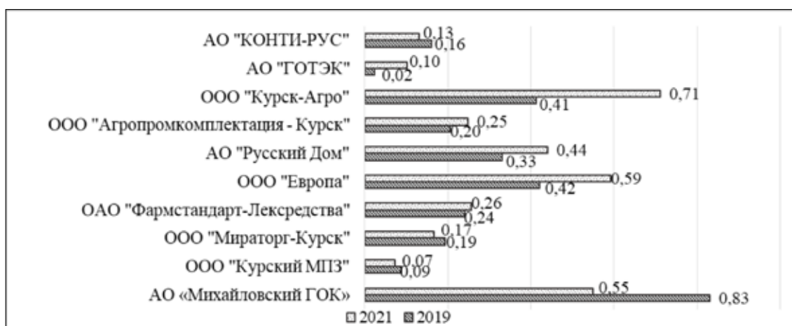
Рис. 1. Сравнительная оценка коэффициента автономии в разрезе топ-10 предприятий-лидеров в Курской области в 2019 и 2021 гг.

В результате можно говорить о том, что на предприятиях-лидерах по объемам производственно-экономической деятельности в Курской области, сохраняется существенная финансовая зависимость от внешних кредиторов. При этом в некоторых из них доля заемных источников формирования имущества доходит до 90% в общей структуре, что актуализирует оценку состава и использования заемного капитала.