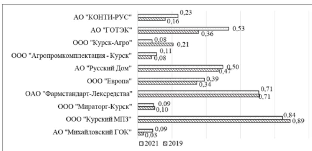
Рис. 5. Сравнительная оценка доли кредиторской задолженности в общем объеме источников формирования имущества в разрезе топ-10 предприятий-лидеров в Курской области в 2019 и 2021 гг.

Кроме того, более 50% на кредиторскую задолженность в структуре пассивов в 2021 году приходится в АО «ГОТЭК» и АО «Русский Дом» (рисунок 5).