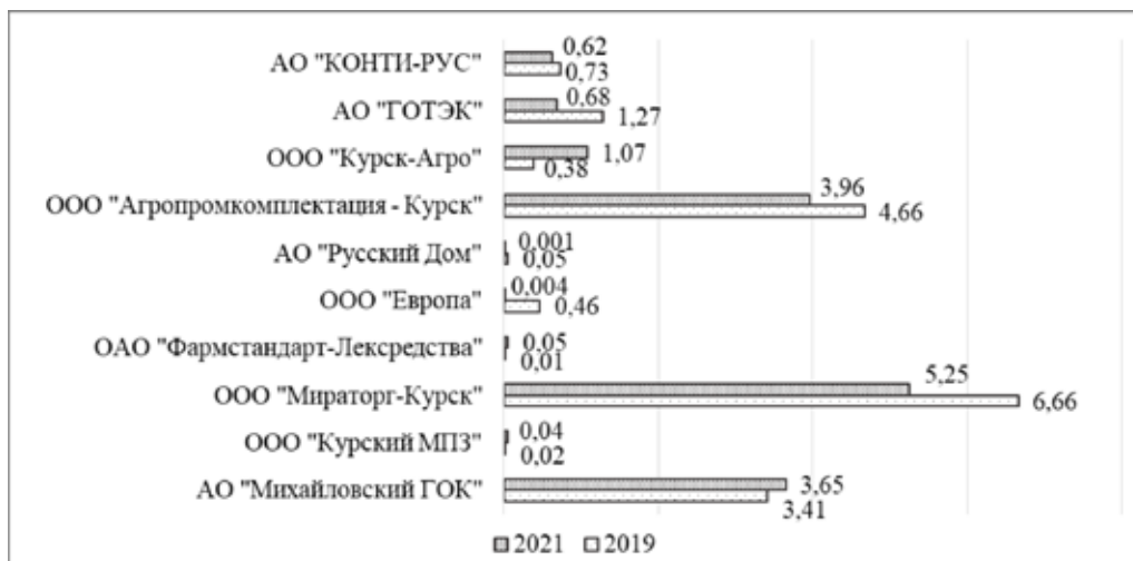
Рис. 4. Сравнительная оценка коэффициента структуры заемных средств в разрезе топ-10 предприятий-лидеров в Курской области в 2019 и 2021 гг.