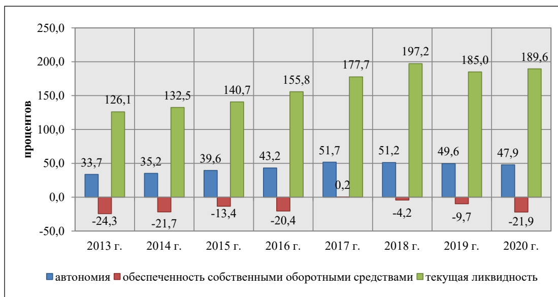
Рис. 1. Динамика финансовых индикаторов развития сельскохозяйственных предприятий Краснодарского края [4]

Степень автономии сельскохозяйственных предприятий региона в финансовом аспекте с 2013 года повысилась, однако она не удовлетворяет нормативу, равному 50%. До 2017 года показатель автономии аграрных организаций Краснодарского края характеризовался положительной динамикой, однако в 2018-м началось постепенное снижение его значения, что также подкрепилось кризисной ситуацией в стране.