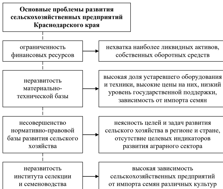
Рис. 4. Основные проблемы развития сельскохозяйственных предприятий Краснодарского края (разработано авторами)

В соответствии со статистическими данными Министерства сельского хозяйства края, уровень финансовой поддержки сельхозпредприятий со стороны государства существенно снизился, что тормозит процессы совершенствования материально-технической базы отрасли: по сравнению с 2013 годом объемы государственного финансирования сельского хозяйства сократились на 21,9%, абсолютное отклонение составило 1169 млн руб.