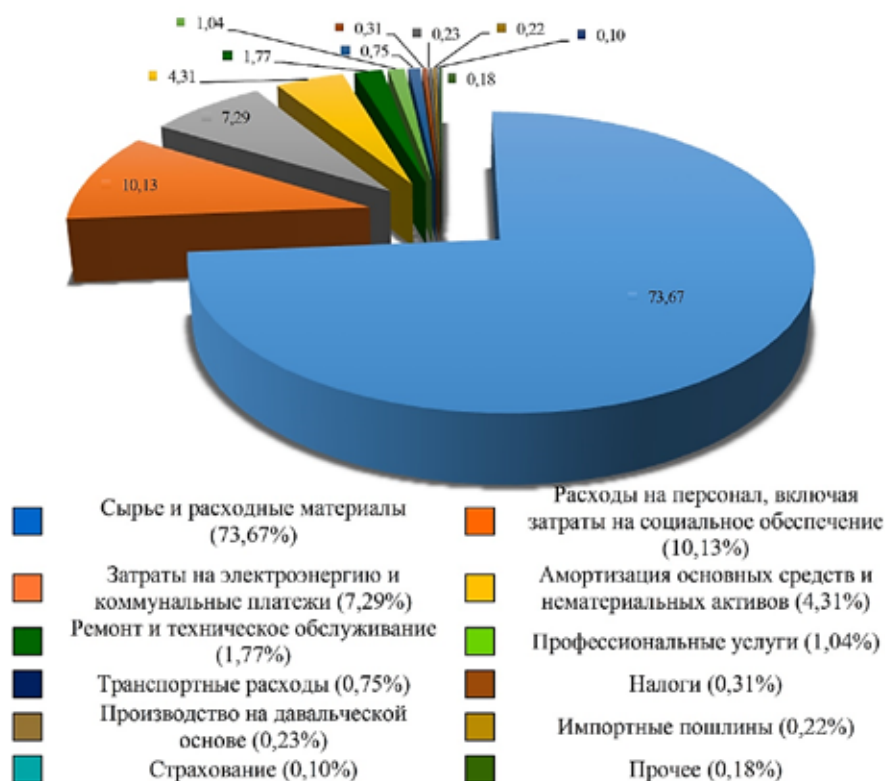
Рис. 3. Обобщенная структура производственных расходов для трубопрокатной отрасли, входящих в себестоимость стальных труб за период 2021 года

На встрече с владельцами металлургических холдингов и министра промышленности и торговли Дениса Мантурова, которая состоялась 16 марта, где Российские власти пытались договориться с металлургами о снижении и фиксации цен на внутрисейском