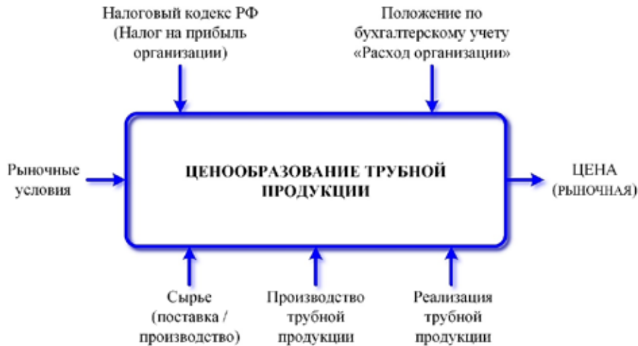
Рис. 1. Процесс «Ценообразования трубной продукции»

Так или иначе, профицит на рынке будет наблюдаться. Но металлургические производства не могут останавливаться. Это не конвейер. Компании будут искать новые сбытовые ниши, новых покупателей, двигаться по рынку или «работать на склад».