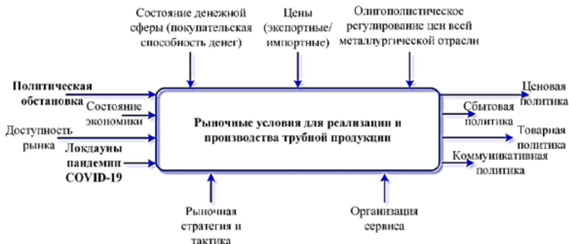
Рис. 2. Подпроцесс «Рыночные условия»