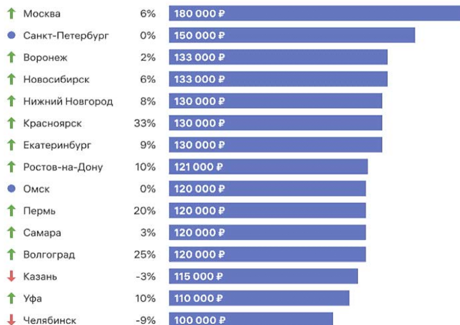
Рис. 2. Динамика и размер заработной платы IT специалистов 6 месяцев 2022 года в сравнении с данными за второе полугодие 2021 года

Однако диплом «с отличием» не гарантируют предпринимателю, что он принимает на работу профессионала. Следовательно, риски увеличения расходов, без гарантии повышения эффективности работы предприятия имеют место быть. Как видно из данных, представленных на рис. 2, по разным регионам России размер заработной платы отличается значительно, независимо от функционала. В большинстве регионов имеется устойчивая тенденция к росту. И по всем регионам отмечается, что размер заработной платы специалистов IT-технологий значительно выше среднего по региону.