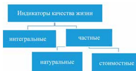
Рис. 1. Структуру индикаторов качества жизни

Качество жизни является постоянно развивающейся экономико-философской категорией, которая определяет уровень материальной и духовной комфортности жизни населения. Повышение качества жизни и его материальная база в свою очередь обусловлены ростом уровня жизни. Кроме потребительских товаров и услуг качество жизни предусматривает и такие результаты экономического и политического развития страны как средняя продолжительность жизни, охрана и условия труда, обеспечение прав человека, уровень и виды заболеваемости, доступность информации и т.д.