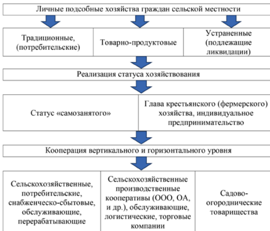
Рис. 1. Основные векторы развития личных подсобных хозяйств