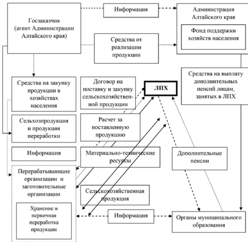
Рис. 3. Схема закупки сельскохозяйственной продукции в хозяйствах населения и дополнительного пенсионного обеспечения лиц, производящих животноводческую продукцию

Прекращение поставок продукции из личных подсобных хозяйств по объективным и субъективным причинам, то есть нарушение воспроизводственных процессов в формировании фонда, создает условия для невыполнения государством взятых на себя обязательств по выплате дополнительных пенсий. Таким образом, на наш взгляд, в качестве выплаты дополнительных пенсий. Таким образом, на наш взгляд, в качестве основного критерия выбора статуса фонда «Поддержка личных подсобных хозяйств» целесообразно рассматривать гарантированное обеспечение государственных обязательств по выплате дополнительных пенсий лицам, которые, работая в личном подсобном хозяйстве, осуществляли поставки продукции.