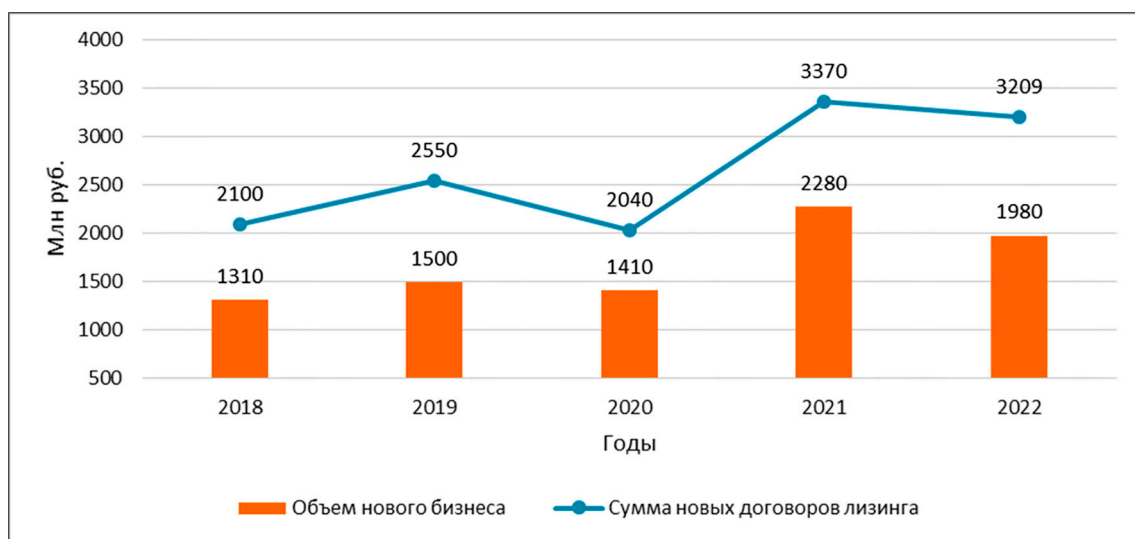
Рис. 1. Показатели объема нового бизнеса и сумма новых договоров рынка лизинга, млн руб.

Временные рамки четвертого этапа развития лизинга обозначены со второй половины 2001 года по настоящее время. В рамках данного этапа происходит реформирование правового поля регулирования лизинга в России. 25 глава Налогового кодекса (2002г.) закрепила льготный налоговый режим для проведения лизинговых операций.