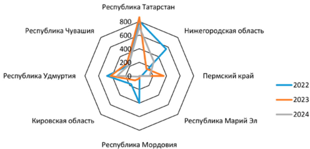
Рис. 1. Субсидии из федерального бюджета на обеспечение комплексного развития сельских территорий регионов Волго-Камского макрорегиона на 2022-2024 гг., тыс. руб. Составлено авторами, источник данных Росстат