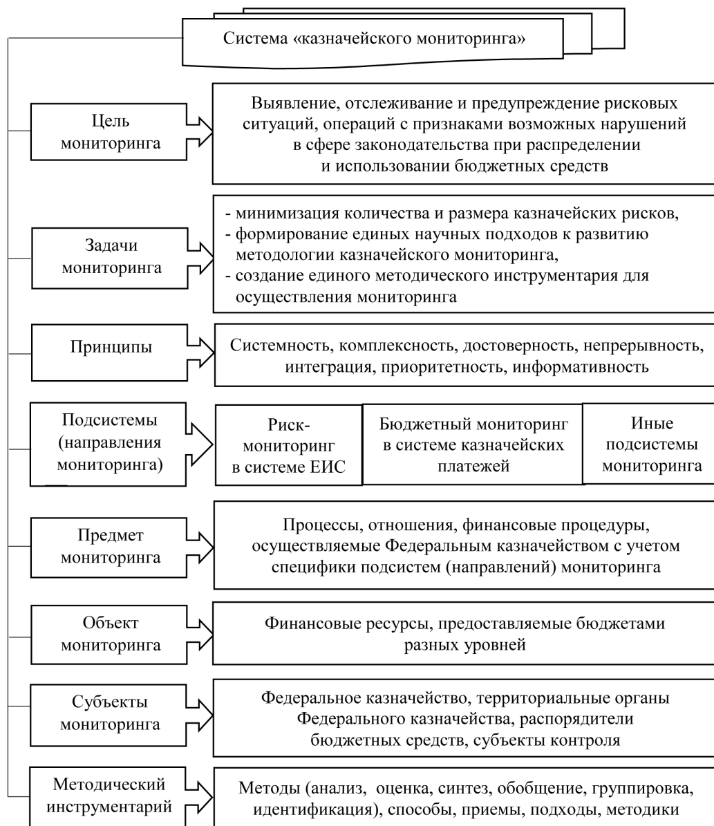
Рис. 2. Концептуальный подход к системе «казначейского мониторинга» в сфере ВГ(М)ФК

торов, нарушений законодательства, препятствующих выполнению поставленных задач. В связи с чем, по мнению автора, концептуальным направлением развития мониторинга является создание единой системы риск-мониторинга в контрольной деятельности Федерального казначейства, которая объединит в единое русло разные его подсистемы (направления), определит вектор развития методологии «казначейского мониторинга», позволит сформулировать единые признаки, определить способы и подходы, обеспечит разработку единого методического инструментария.