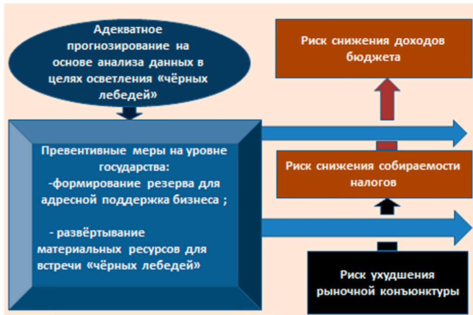
Рис. 3. Пример разрыва кольцевой структуры рисков

В приведённом примере факторным риском, запускающим кольцевую структуру рисков и разрушительный механизм положительной обратной связи является риск ухудшения рыночной конъюнктуры. На практике этот риск играет роль своеобразного спускового крючка, запускающего множественные кольцевые структуры различных рисков.