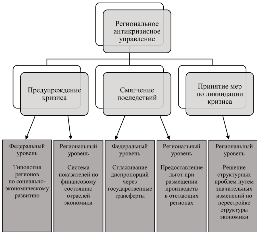
Рис. 1. Направления и основные методы регионального антикризисного управления по уровням