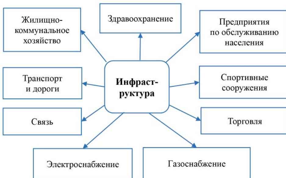
Рис. 3. Состав инфраструктуры сельских территорий