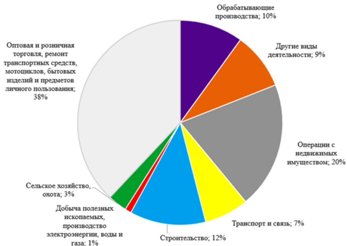
Рис. 2. Отраслевая структура сектора МСП в России в 2022 году [1]

Увеличение количества субъектов МСП произошло по Центральному федеральному округу (8,9%); Северо-Западному федеральному округу (1,3%); Северо-Кавказскому федеральному округу (5,4%) и Дальневосточному федеральному округу (17,8%). Вместе с тем, тенденция уменьшения количества субъектов МСП проявилось в Южном федеральном округе