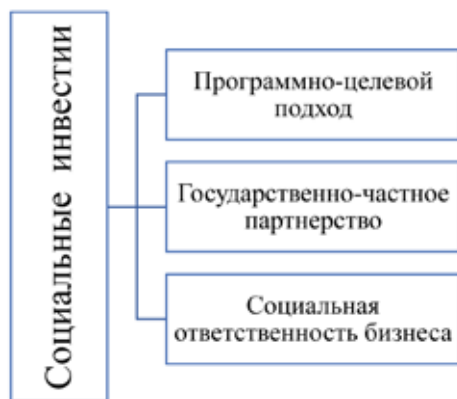
Рис. 3. Основные подходы в финансировании социальной сферы

Следует отметить, что большая финансовая нагрузка при реализации национальных проектов приходится на бюджетную систему в условиях внешних вызовов и угроз.