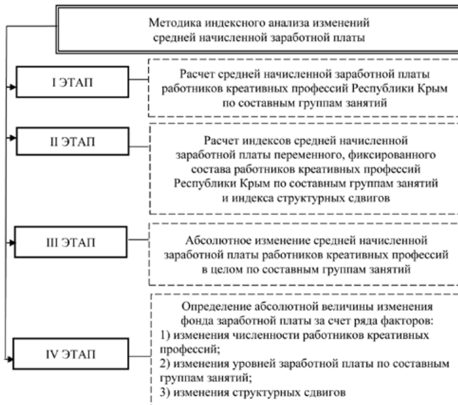
Рис. 2. Этапы методики индексного анализа изменений средней начисленной заработной платы

В данном исследовании сделан акцент исключительно на данных креативных профессиях, учитывая особенности развития рынка труда Республики Крым.