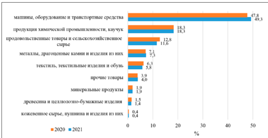
Рис. 2. Товарная структура импорта РФ за 2020-2021 гг. (составлено автором на основе [8])

По оценкам экспертов объемы экспортно-импортных поставок во втором квартале 2022 года сократились почти в два раза. В третьем квартале ситуация стабилизировалась, объемы постепенно выровнялись. На положительную динамику импорта повлияло создание новых цепочек поставок, а также расширение списка товаров, разрешенных для параллельного импорта. Согласно данным министра промышленности и торговли России Мантурова Д. В., за месяцы работы в рамках параллельного импорта объем ввезенных на территорию нашей страны товаров составил около 9,4 млрд долл. По итогам 2022 г. прогнозируется сумма около 20 млрд долл.[1].