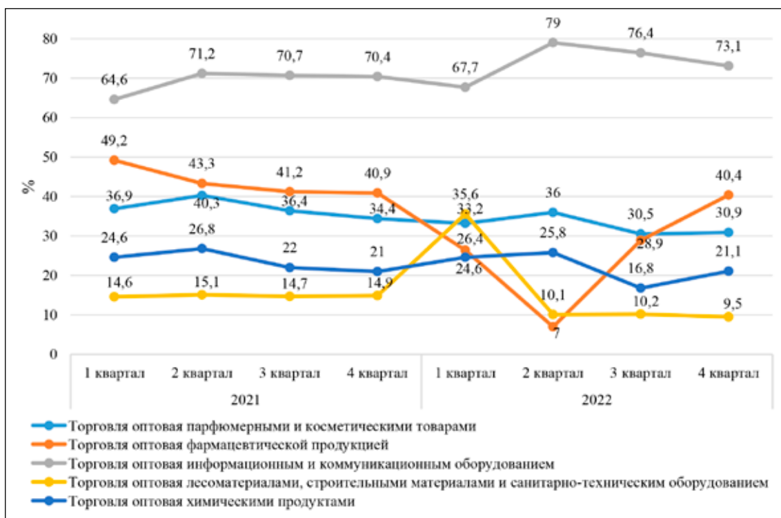
Рис. 3. Доля импортной продукции в общем объеме товарооборота за 2021-2022 гг. (по данным ЕМИСС)

Второе место в структуре импорта России занимает продукция химической промышленности (18,3%), включающая фармацевтическую продукцию, органические химические соединения, продукты неорганической химии, удобрения, краски, лаки, эфирные масла и пр. Эта продукция поставляется преимущественно из Китая, Германии, Италии. Третье место (11,6%) относится к категории «продовольственные товары и сельскохозяйственное сырье»: напитки алкогольные и безалкогольные, экстракты и концентраты чая и кофе, соусы, вкусовые добавки, какао, продукты переработки овощей, фруктов, орехов, поставляемые в основном Белоруссией, Германией, Италией, Францией, Китаем.