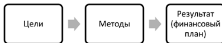
Рис. 1. Простая модель процесса финансового планирования

В зависимости от поставленных целей выбирается соответствующий метод расчёта конкретного показателя финансового плана. В арсенале финансового управляющего есть несколько наиболее применимых методов; в частности, наиболее распространёнными являются балансовый метод, нормативный, расчётно-аналитический, метод оптимизации плановых решений, экономико-математическое моделирование. Каждый из методов имеет свою сферу применения и свои ограничения.