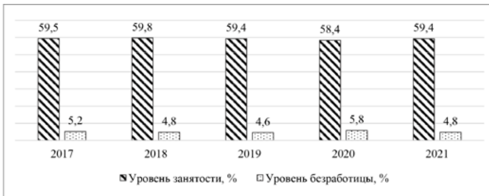
Рис. 3. Динамика уровня занятости и безработицы в России в 2017-2021 гг.