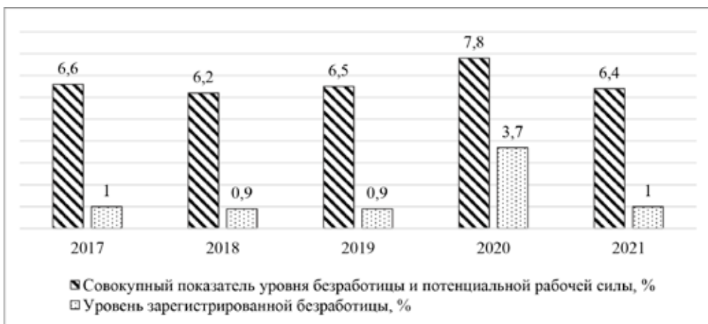
Рис. 4. Динамика уровня совокупной и зарегистрированной безработицы в России в 2017-2021 гг.

Оценка уровня зарегистрированной безработицы показала, что доля экономически активного населения, состоящего на учете в службе занятости, в 2017 году составляла всего лишь 1%, а в 2018-2019 гг. – 0,9%, что связано с низкой степенью доверия среди населения органам службы занятости в содействии поиску работы. Однако в 2020 году, на фоне начала пандемии и качественного повышения размера пособий по безработице, интерес к данному направлению возрос, в результате чего уровень зарегистрированной безработицы вырос до рекордных 3,7%. Однако уже в 2021 году, на фоне улучшения ситуации, отмечается снижение уровня зарегистрированной безработицы до 1% (рисунок 4).