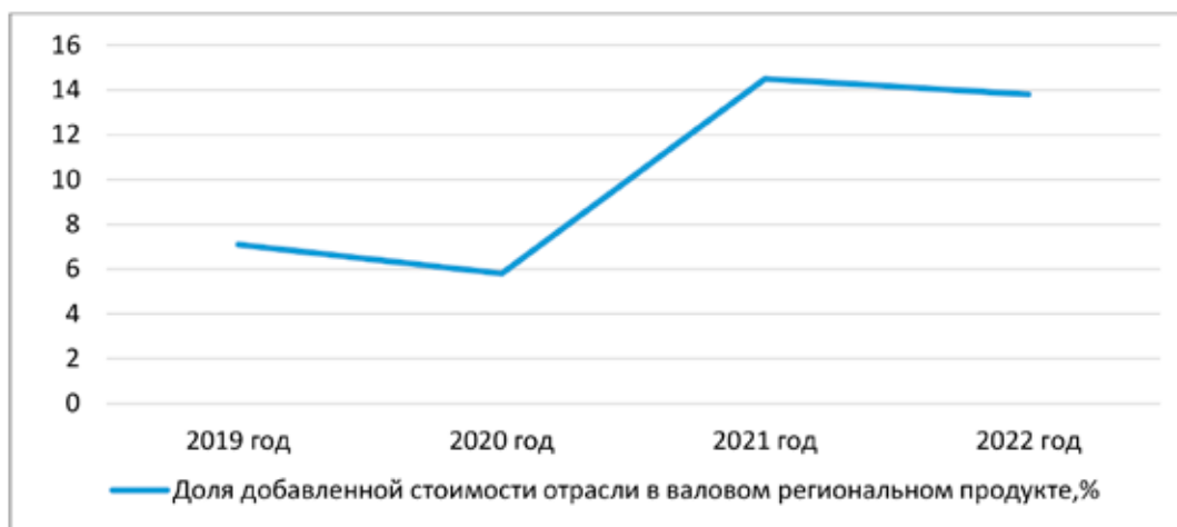
Рис. 1. Изменение доли добавленной стоимости санаторно-курортной отрасли в валовом региональном продукте за 2019-2022 годы, %

Инвестиционный портфель санаторно-курортной отрасли Краснодарского края в 2022 г. составил около 271 млрд руб., что выше показателей 2021 г. более чем в два раза. В этом