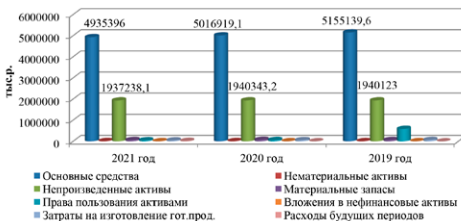
Рис. 1. Динамика составляющих нефинансовых активов ФГБОУ ВО «Университет» за 2019–2021 гг., тыс.руб.

Величина нефинансовых активов 2020 г. снизилась на 658776,7 тыс.руб. и составляла 7181809,5 тыс.руб. к уровню 2019 г., к 2021 г. их стоимость сократилась еще на 101772,5 тыс.руб. до 7080037 тыс.руб. Величина финансовых активов увеличилась за анализируемый период на 254342,9 тыс.руб. и составила 4461503,8 тыс.руб.